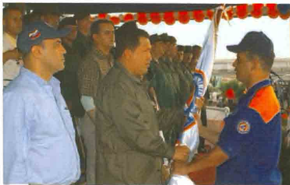
Entrega de Estandarte de la Fuerza de Tarea Humanitaria "Simón Bolívar"