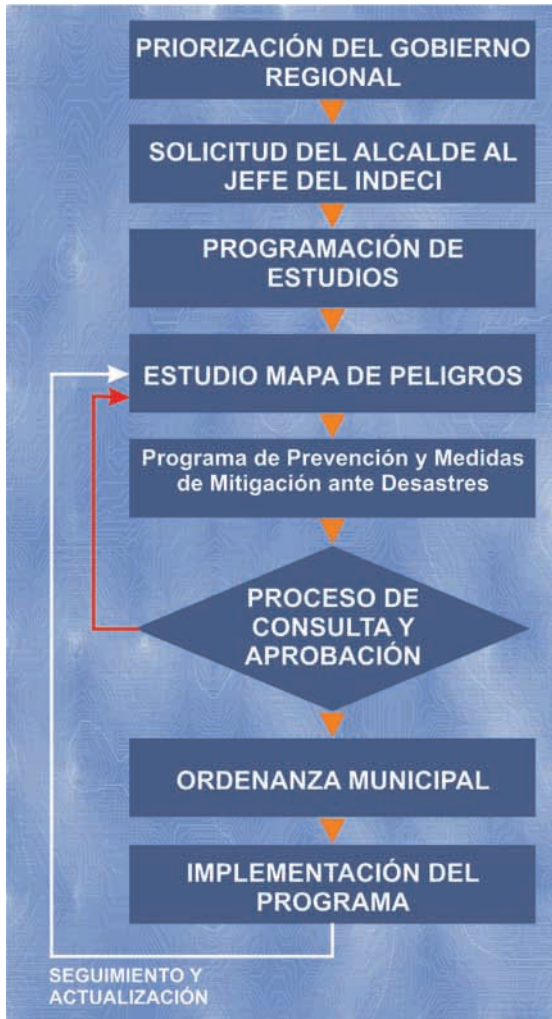
Gráfico N° 1 Pasos para la Ejecución del PCS

Priorización del Gobierno Regional, el que recomienda las ciudades que se podrían incorporar al PCS en atención a su situación de riesgo, magnitud poblacional, antecedentes de desastres o emergencias y rol económico en la región.