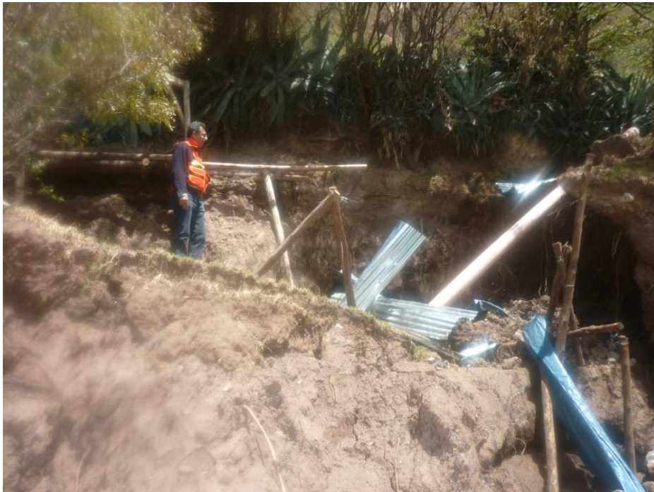
Foto 16.- Canal colapsado en un tramo aproximado de 80 ml.