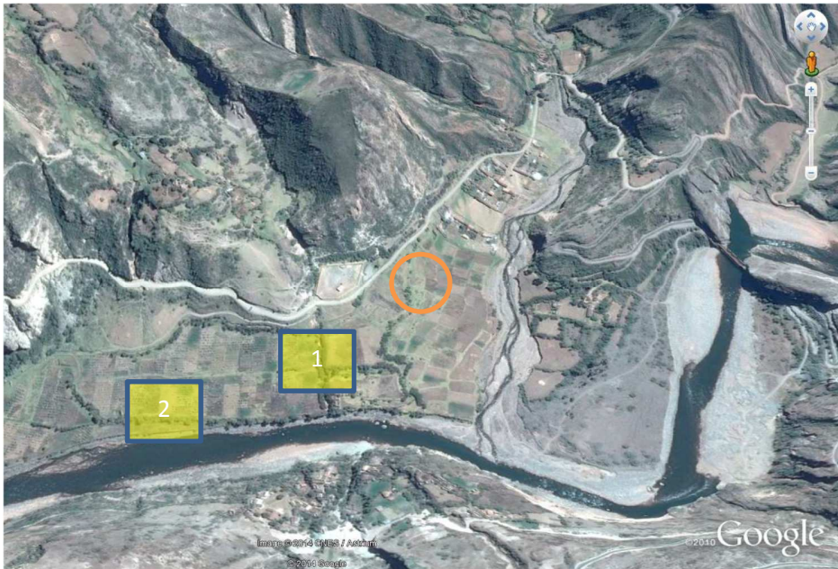
Foto 8: Posibles zonas de reubicación de la CC-CISUBAMBA (1 y 2). 14 familias reubicadas en la entrada de Tendalpampa (circulo naranja).