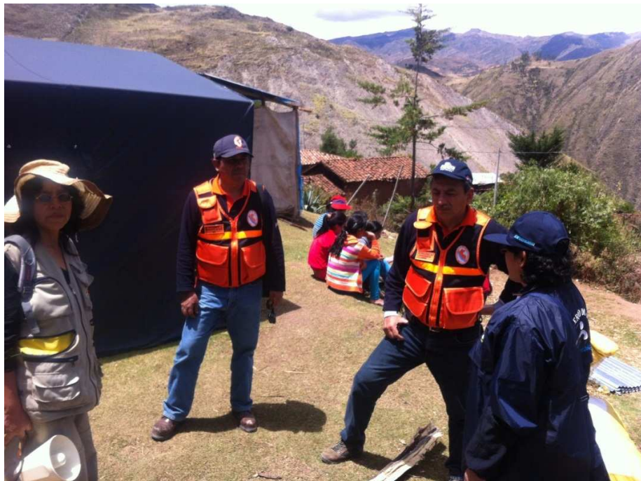
Foto 14. Coordinación con los representantes del Ministerio de Cultura y Salud.