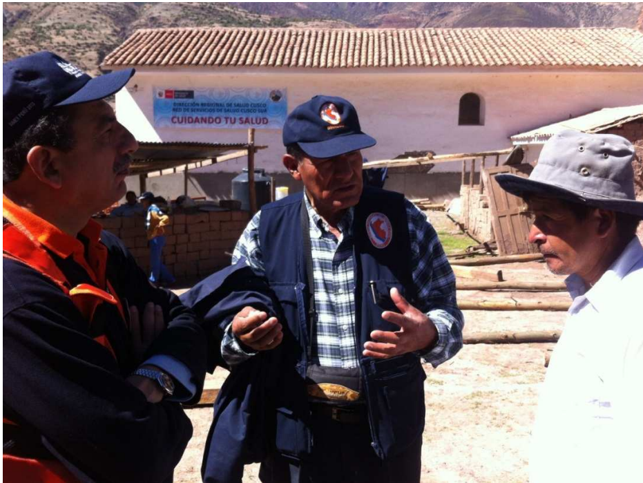
Foto 7: Reunión de Coordinación con el Presidente de la Comunidad - Cusibamba.