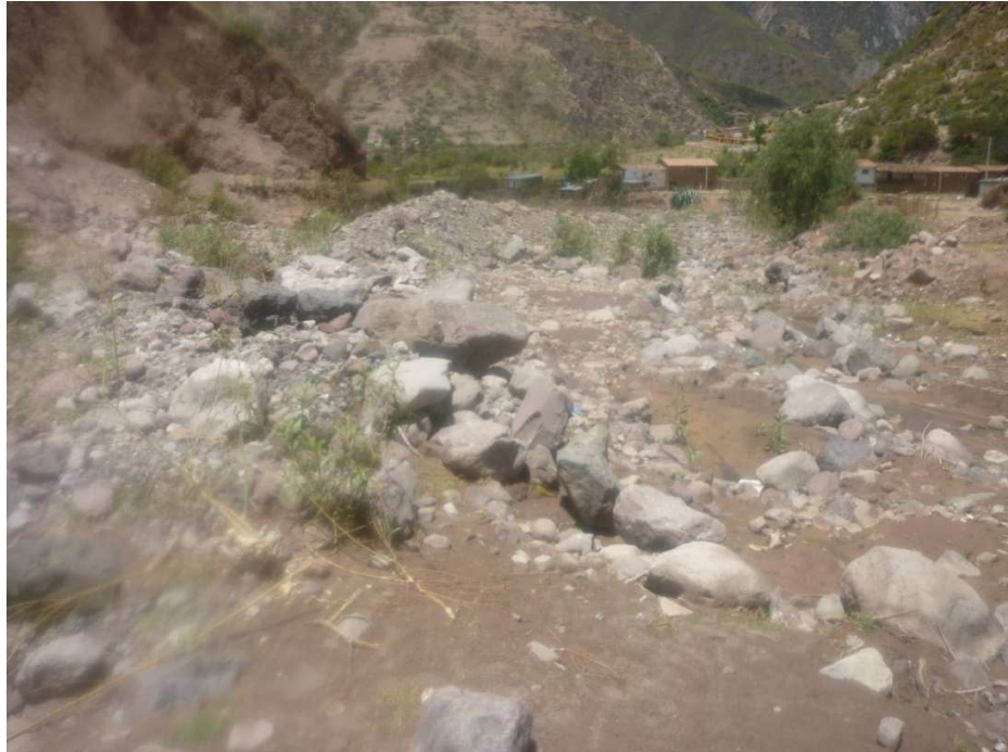
Foto 17.- Cauce del río Cusibamba, se encuentra en peligro por desborde e inundaciones.