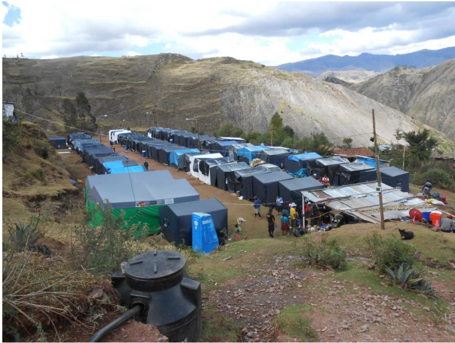
Foto 3: Imagen panorámica de la ubicación de las carpas en la CC-MISCA.