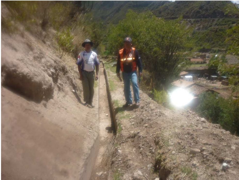
Foto 15.- Canal presenta resquebrajadura o grietas.