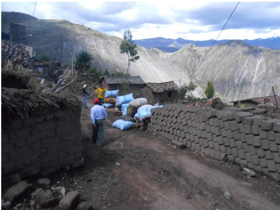
Foto 4. Damnificados recuperando sus pertenencias en la CC-MISCA.