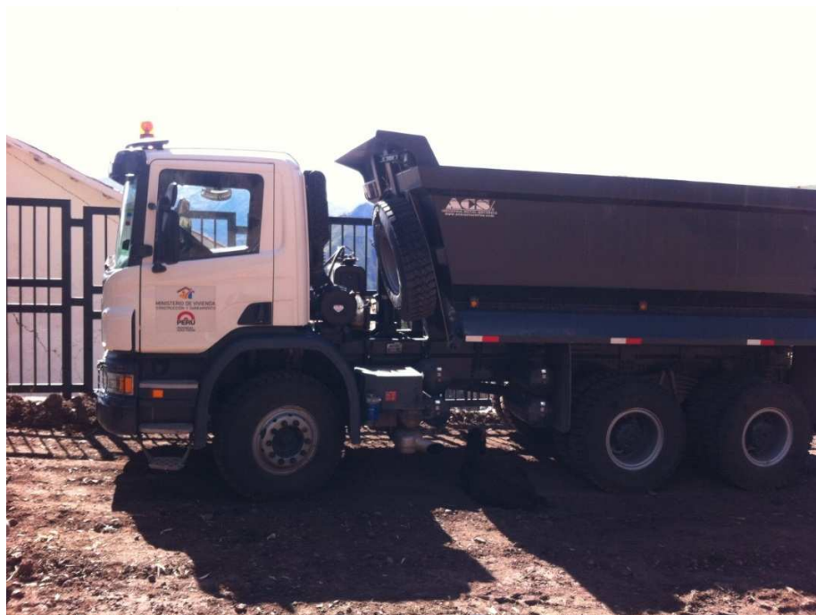
Foto 12: Volquete con logo del Ministerio de Vivienda, sin actividad desde el 08OCT2014. Placa EGM-777