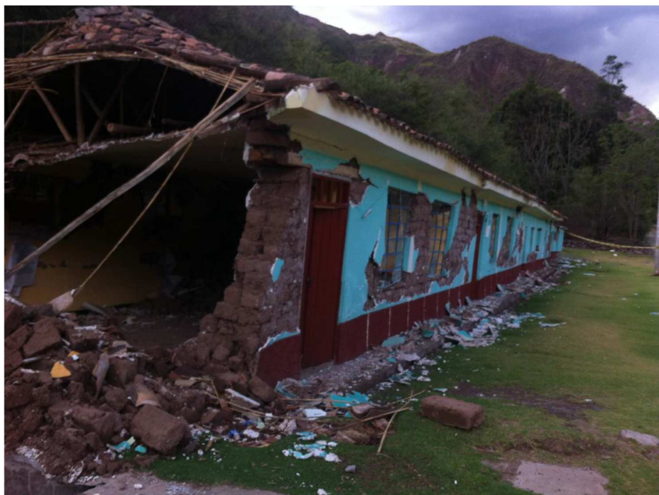
Foto 5. Aula colapsada en la CC-CUSIBAMBA.