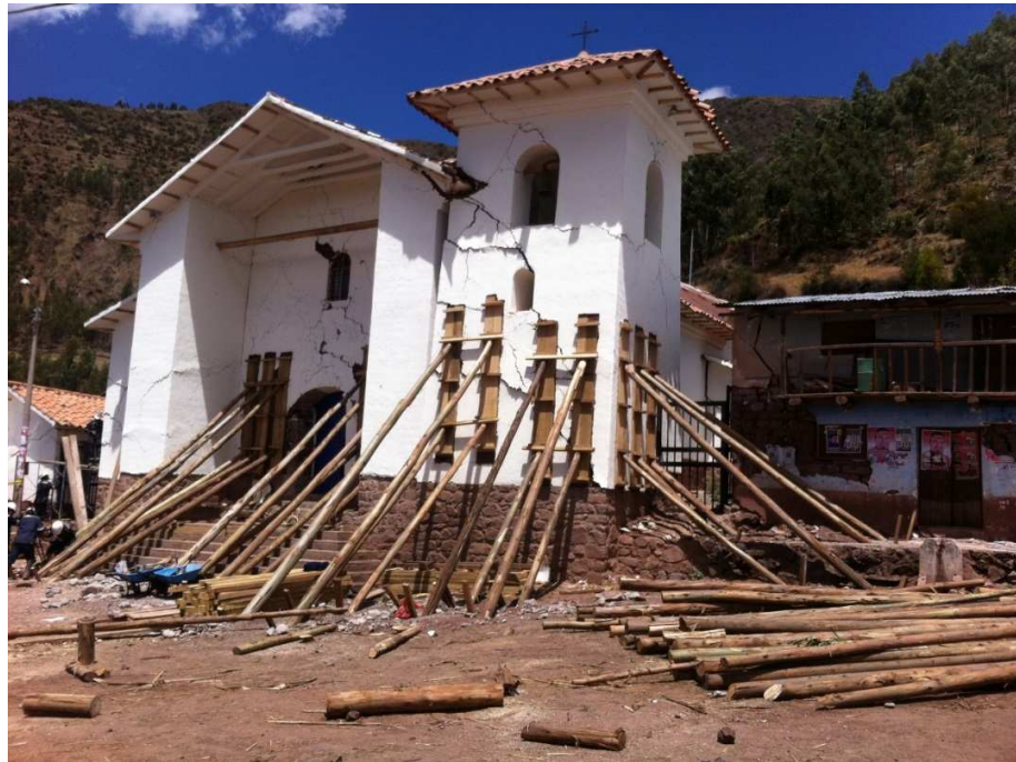
Foto 11: Apuntalamiento de la iglesia de la CC_MISCA por parte del equipo del Ministerio de Cultura.