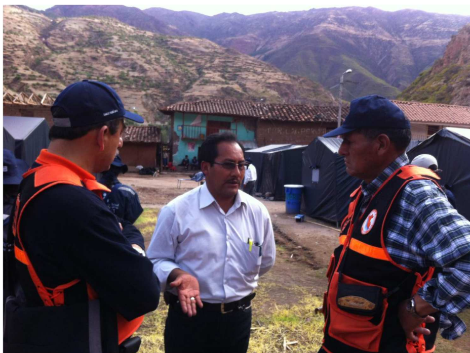
Foto 6. El Alcalde Provincial explicando al personal del INDECI las acciones que implementará en la CC-CUSIBAMBA.