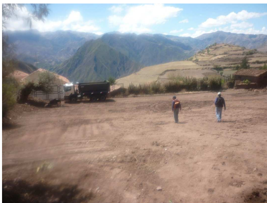
Foto 10. Verificación de la zona de reubicación de la CC-MISCA. Al lado de la Iglesia.