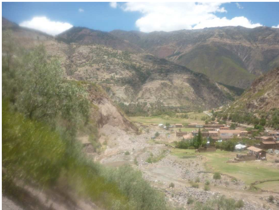
Foto 18. La descolmatación del río Cusibamba, requiere aprox. 600 ml.