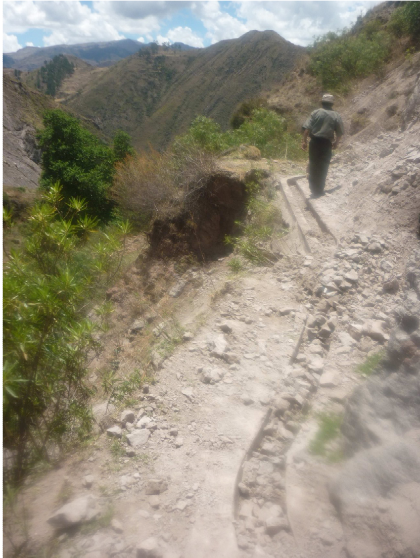
Foto 19. Canal de riego patepanco afectado en la CC-MISCA.