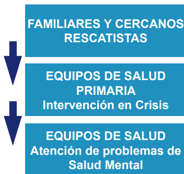
Fig. N° 4 Gradualidad del Apoyo Psicosocial 16

La ayuda psicosocial se debe entregar en forma escalonada, según las necesidades de los afectados (Fig. N°4)