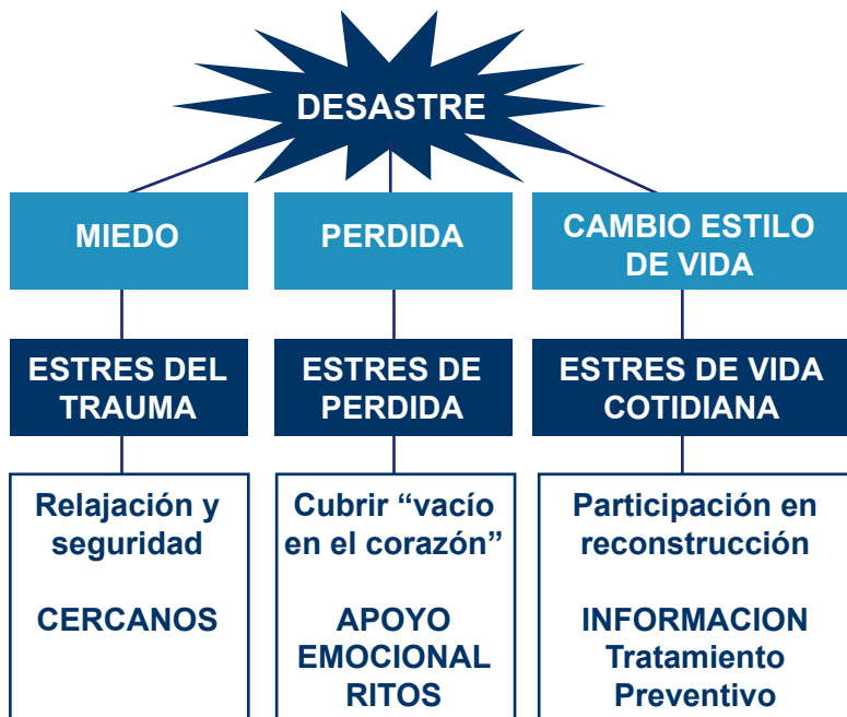
Fig. Nº 5 Tipos de Estrés que generan las situaciones de Emergencias y Desastres 18

El Estrés se define como un síndrome de activación psicofisiológica que prepara al organismo para una respuesta de ataque o huida frente a una amenaza inminente.